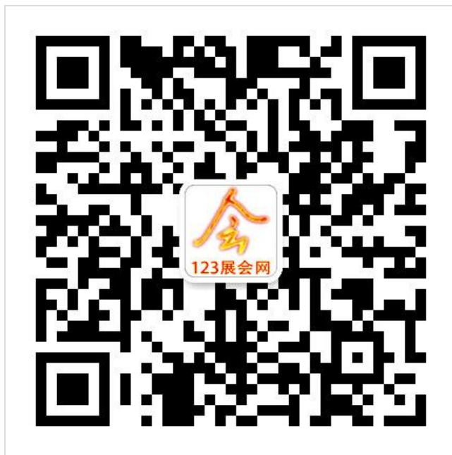
微信客服二维码请扫一扫