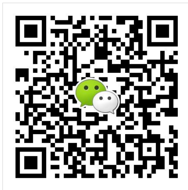
微信客服二维码请扫一扫